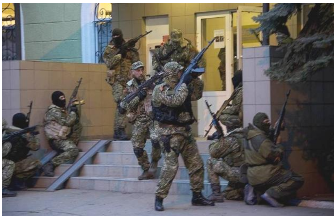
Початок Антитерористичної операції

До рук мені потрапив путівник зоною конфлікту «Донбас в огні...», виданий у Львові у 2017 році, за сприяння Канадського Фонду підтримки місцевих ініціатив. Цей путівник допоміг відтворити хроніку війни на Донбасі, починаючи з квітня 2014 року [67].