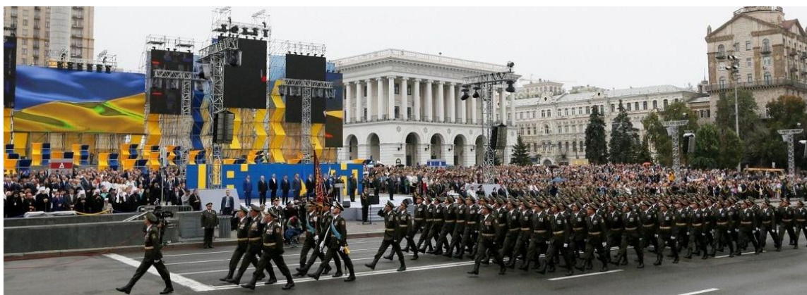
Реформування Збройних Сил України

Восени 2017 року міністр оборони України Степан Полторак з впевненістю заявляв: «Бюджет на наступний рік буде достатнім для того, щоб зробити важливий крок уперед і досягти максимальних результатів у реформуванні Збройних Сил, переозброєнні, оснащенні, підготовці» [77].